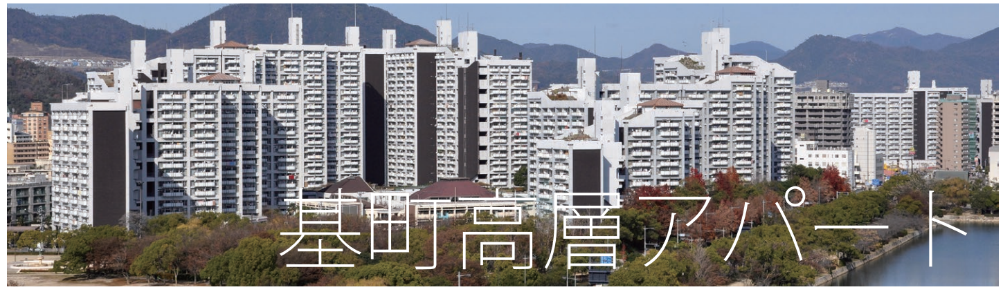
主催 アーキウォーク広島 http://www.oa-hiroshima.org プロジェクトアドバイザー open! architecture 実行委員会 http://open-a.org