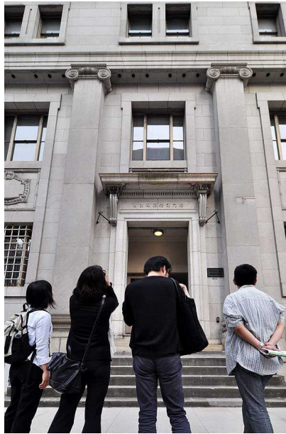
旧日本銀行広島支店