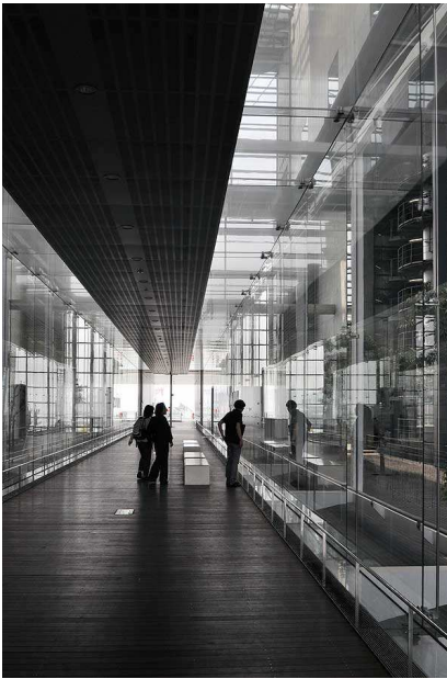
広島市環境局中工場

主として広島市内の建築物の写真を展示します。このように、見慣れた建物でも普段とは異なる切り口で見ると新たな発見があります。